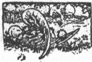
UM LUNAR EM REPOUSO

O capitão, com a espada enfiada numa aza, caía através do espaço, dando altos gritos. Pensamento, tirando da pequenina bolsa que trazia a tiracollo, um delicado instrumento musical, emittiu um som agudissimo de alarma.